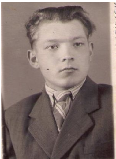
Рис.19. Фото по окончании института

Кроме игры на танцевальных вечерах, ежегодно участвовали в городском студенческом смотре художественной самодеятельности, для чего разучивали достаточно простые классические произведения для духового оркестра. Это был уже третий выход на сцену, но в коллективном качестве.