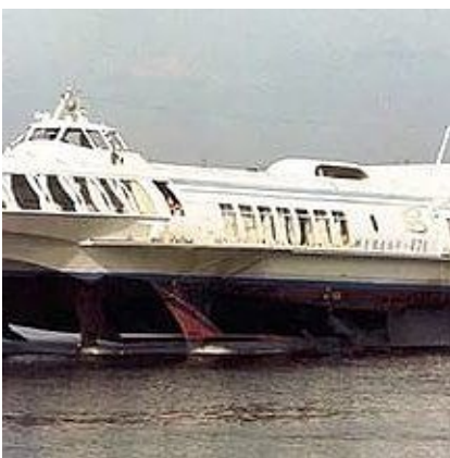
Рис.20. Речной судно Метеор

В первые же месяцы работы по распоряжению ветеринарного отдела был направлен в командировку в Змеиногорский район для проведения противоэпизоотических мероприятий при ящуре. Другая длительная командировка была в Бийскую контору скотоимпорта с поездкой в Монгольскую Республику для закупки скота. Однако проработав около месяца, вернулся на место работы, так как в это время в МНР возникла вспышка ящура, и закупка скота была прекращена.