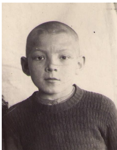
Рис. 11 . Фото, бывшее на стенде школы

Учился в 5-ом классе хорошо, фото было помещено на стенде: лучшие ученики школы (рис. 11). Особенно большое прилежание было к математике, несколько хуже к русскому языку, поскольку сказывалось влияние местного акцента, которые присутствует почти на всех территориях.