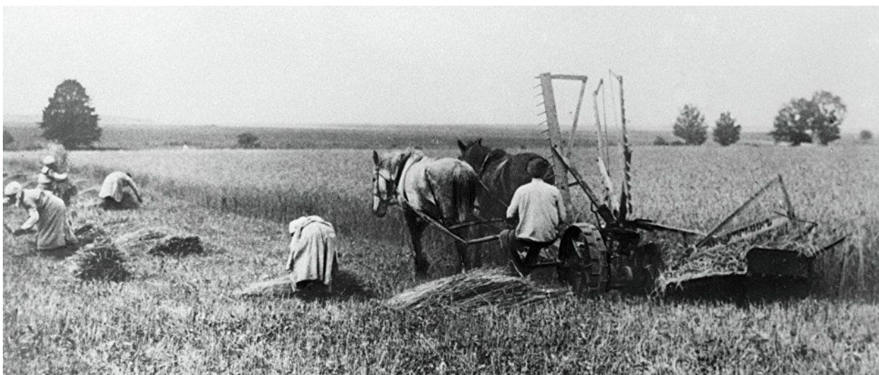
Рис. 6. Уборка посевов с помощью жатки-самосборки

Хлебопашеством занимались вплоть до социальных изменений в 90 –х. годах прошлого века. С развалом коллективного хозяйствования в колхозах и совхозах сразу же забросили эту работу в описываемом районе, поля стали зарастать дикой травой и мелкими березками, которые с годами становились полноценным лесом. Забросили также занятие общественным животноводством. Большинство жителей Горнослинкино, единственного оставшегося в окрестности села, перестали держать даже любую живность для собственного потребления. Все продукты завозят в магазины. Жители стали работать вахтовым методом на северных нефте - газопромыслах.