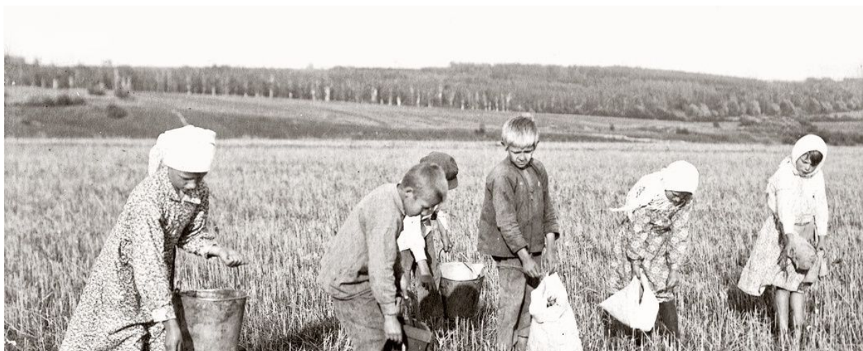
Рис. 12 Школьники за сбором колосьев

Учась в школе, учеников привлекали к работам. Таким как сбор колосьев, оставшихся после механической уборки (рис.12).