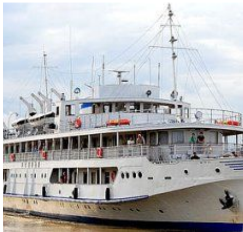
Рис. 18. Дизельтеплоход «Родина»

Как и при учебе в техникуме, так и в институте пришлось жить на одну стипендию, некоторые семестры сдавал на отлично и получал повышенную стипендию. В первый год учебы изредка попадал в студенческую рабочую бригаду для выполнения разных погрузочно-разгрузочных работ, за что получали определенную оплату, что служило подспорьем в жизни.