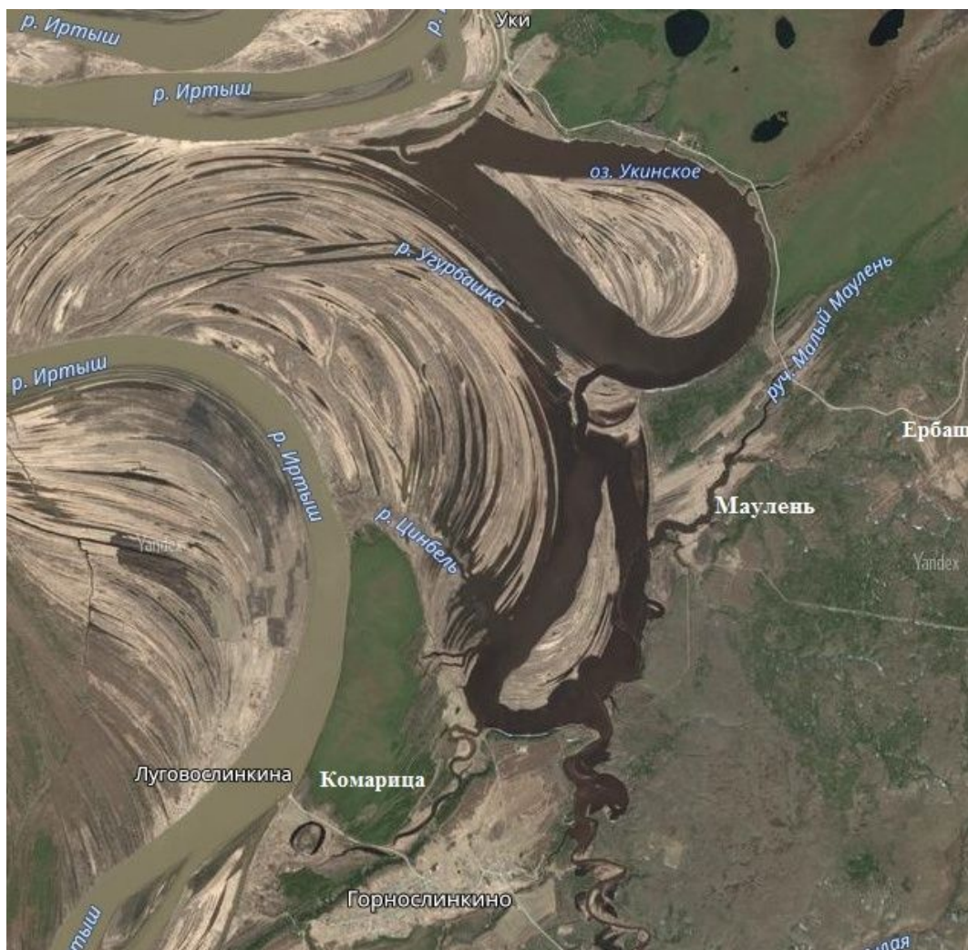
Рис.1 . Территория близлежащих деревень к Маулени, современный спутниковый вид

Деревня Маулень расположена по берегам в устье одноименной реки Большой Маулень, протяженность которой 12 км, приток реки Ингаир, который в свою очередь впадает в реку Иртыш у татарских юрт Уки.