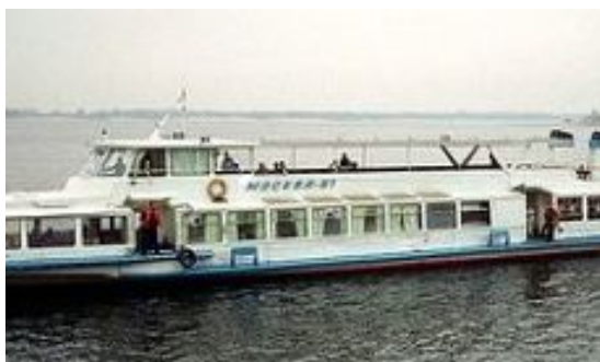
Рис. 16. Речной трамвайчик типа Москва

Значительно легче стало ездить в летнее время. Стал курсировать речной трамвайчик типа Москва, ходивший ранее только до села Надцы