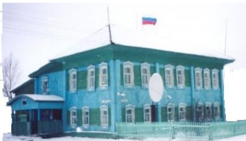
Рис.8. Вид здания Мауленской школы с незначительной реконструкцией после перевозки.

Школа в деревне Маулень образована в 1939 г. и размещалась в единственном в деревне двухэтажном здании с надворными также двухэтажными постройками, объединенных единой оградой с въездными воротами и калиткой для входа. По-видимому, оно принадлежало зажиточному человеку, судьбу которого можно только представить по складывающейся ситуации того времени, связанной с раскулачиванием и образованием колхозов. Основное здание в 80-е годы было перевезено в Горнослинкино и использовалось как административное учреждение (рис.8).