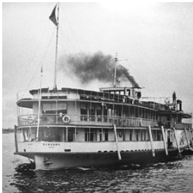
Рис. 13. Колесный проход на угольном топливе

экзаменов я жил у родственников. Узнав о моих оценках в аттестате, они рекомендовали подать документы в другое учебное заведение, например, в рыбный техникум, но я уже был нацелен на вышеуказанный техникум и не смел самостоятельно изменить решения в силу своего деревенского происхождения, воспитания и развития.