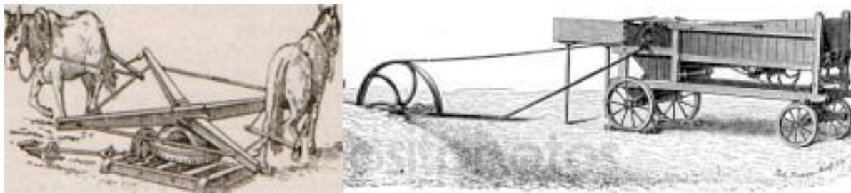
Рис.5. Схематический вид конной молотилки

На отдельных полях иногда появлялись лобогрейки или жатки-самосброски - специальные жатки для уборки хлеба. Лобогрейка — простейшая жатвенная машина, применявшаяся для уборки основных зерновых культур (рожь, пшеница, овес, ячмень). Она производит только срезание стеблей убираемой культуры и укладывает их на платформу. Сбрасывание же срезанного хлеба с платформы производится вручную, что требует большого физического напряжения от рабочего, выполняющего эту операцию, и отчего машина получила своё название «лобогрейка» (второе сидение). Первое сидение для управления лошадьми. Обычно в них запрягают две лошади, но в наше время впереди коренного ставили еще одну лошадь, которой управлял подросток. Он создавал направление движения всего агрегата.