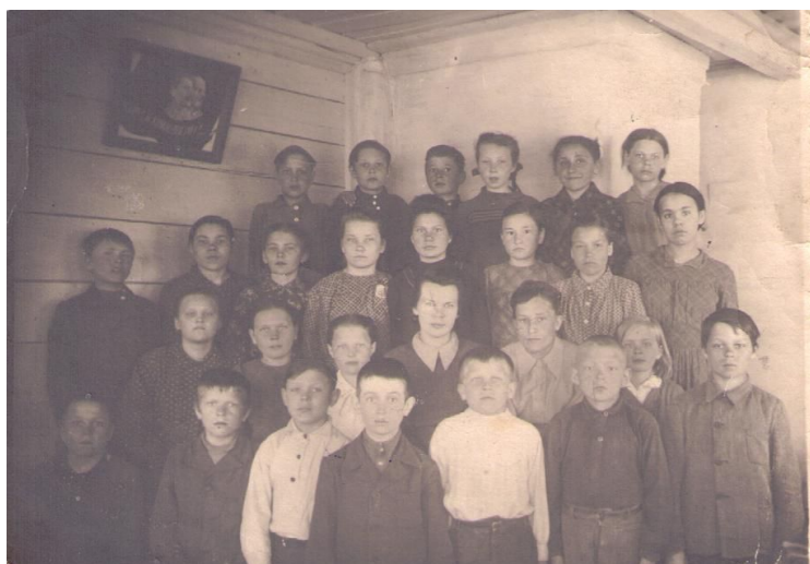
Рис. 10. Ученики 5 класса Горнослинkinской школы (второй справа – автор)